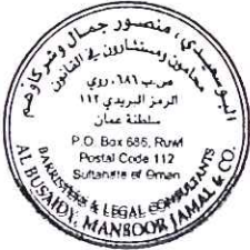
المستشار القانوني Legal Advisor