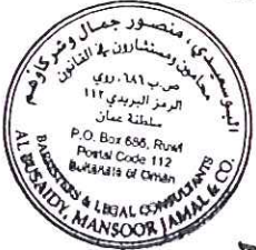
المستشار القانوني Legal Advisor