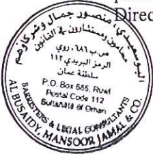
المستشار القانوني Legal Advisor