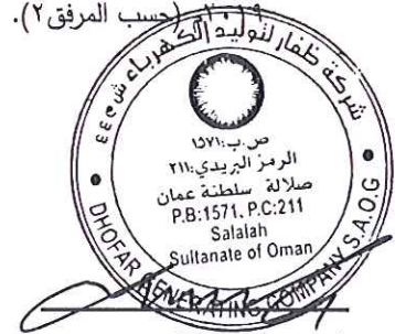
رئيس مجلس الإدارة Chairman